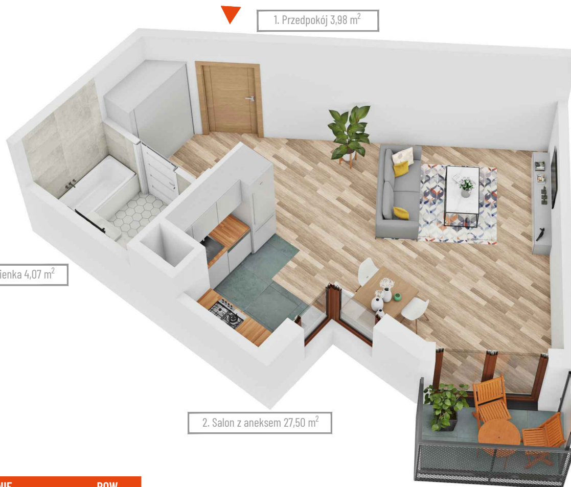
1. Przedpokój 3,98 m 2